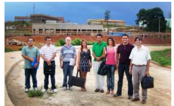
Equipe da Pró-Reitoria de Pesquisa e Pós-Graduação no Campus do Mucuri

Numa proposta de aproximação do trabalho da administração com a comunidade acadêmica, a equipe da Pró-Reitoria de Pesquisa e Pós-Graduação da UFVJM se reuniu nos dias 18 e 19 de março, no Campus Avançado do Mucuri (CAM), com todos os docentes da Faculdade de Ciências Sérias Aplicadas e Exatas (Facsae) e do Instituto de Ciência e Tecnologia (ICT), em Teófilo Otoni.