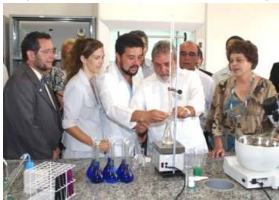
Presidente Lula visita Laboratório do CAM e participa de teste com professores da casa