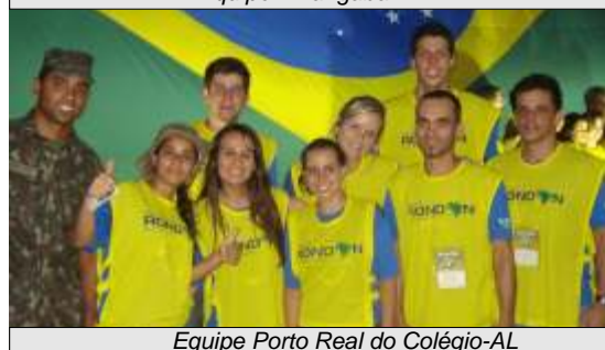
Equipe Porto Real do Colégio-AL