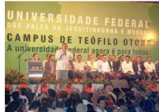
Presidente Lula durante seu discurso para o público presente na inauguração do CAM