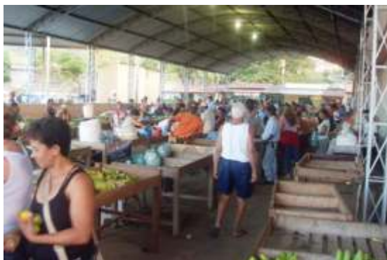
Venda de mercadorias produzidas pela agricultura familiar no Vale do Mucuri

Durante essa primeira fase foram aplicados mais de 400 questionários e visitadas cerca de 600 comunidades rurais dos 27 municípios que compõem o Território, possibilitando uma abordagem quantitativa e comparativa com as informações levantadas em 2005. Essa etapa servirá de embasamento para a segunda fase, já em andamento, que aprofundará questões que se mostraram mais urgentes, a partir do uso de Diagnósticos Participativos e outras metodologias de diálogo.