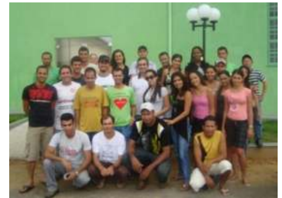
Estudantes do Procampo da UFVJM em Araçuaí, no dia da aula inaugural

Durante o evento os discentes, além de participarem das atividades proposta para a semana, terão acompanhamento da equipe pedagógica do Procampo com a finalidade de darem prosseguimento aos seus trabalhos de pesquisa já iniciados.