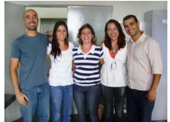
Preceptores do projeto de Residência Profissional