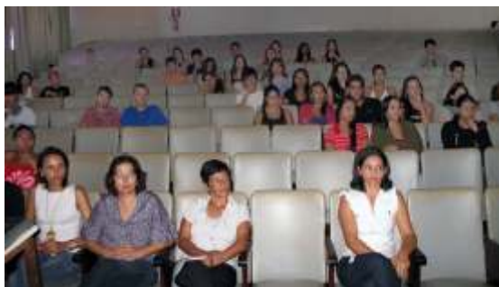
Representantes da Proace, Biblioteca e Prograd participam da recepção aos novos alunos

Na oportunidade, destacou-se a importância do Exame Nacional de Desempenho dos Estudantes (ENADE),