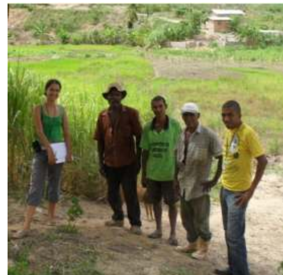
Grupo de pesquisadores com agricultores familiares no campo

O projeto conta ainda com parceiros como o Colegiado Territorial do Vale do Mucuri, CMDRS's, Prefeituras Municipais, Sindicatos dos Trabalhadores Rurais e Associações Comunitárias Rurais.