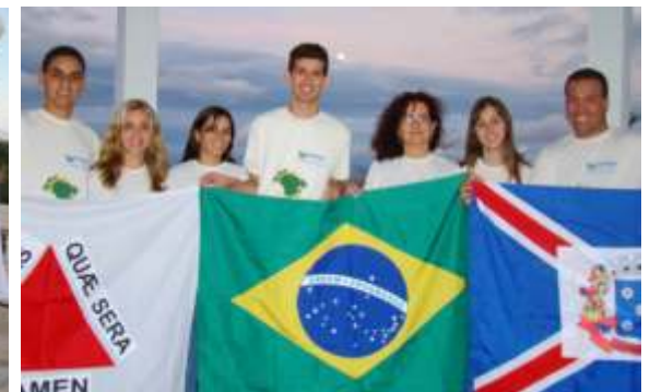
Equipes da UFVJM participantes do Rondon Operação Nordeste-Sul 2009