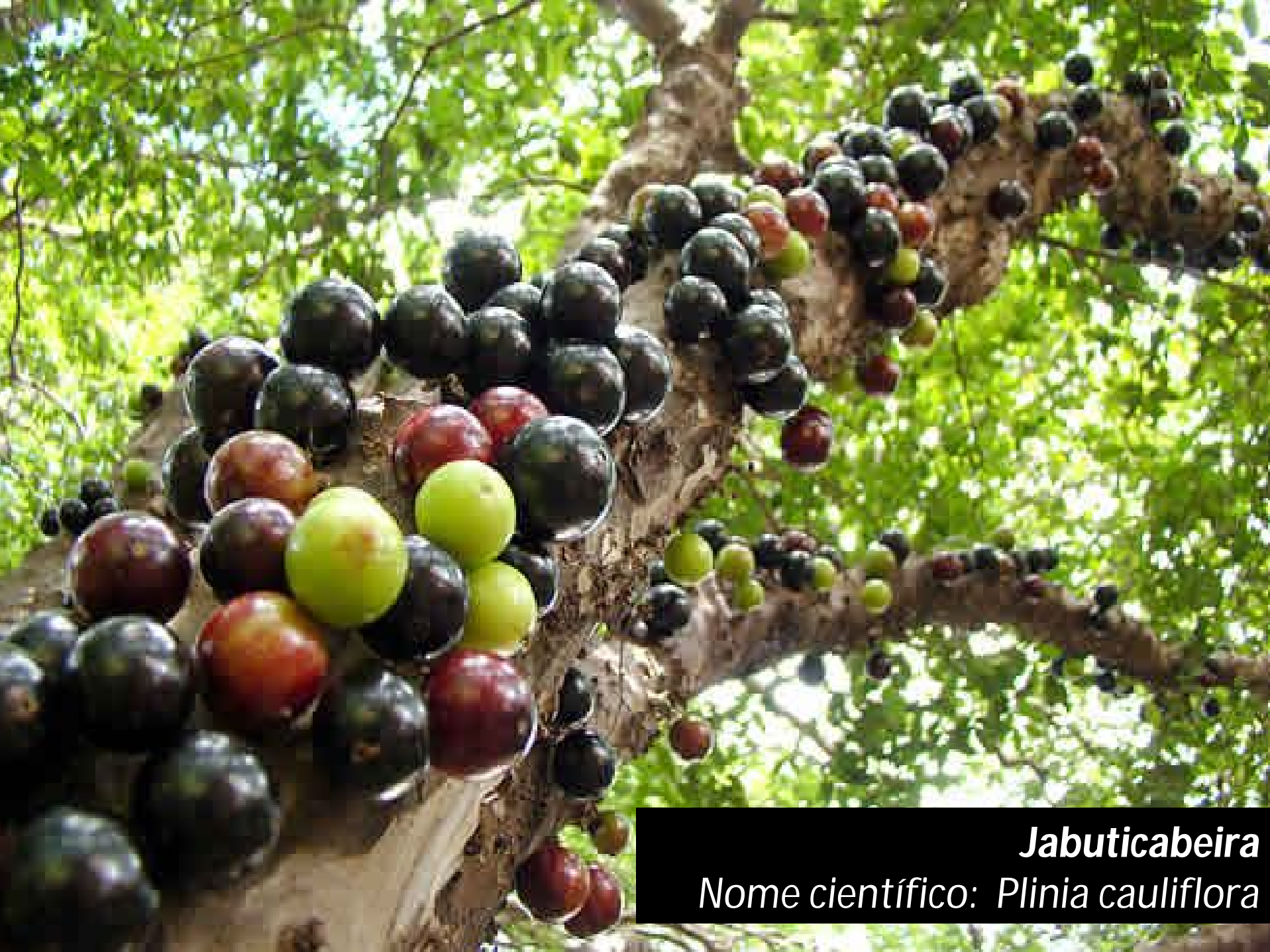
Jabuticabeira Nome científico: Plinia cauliflora