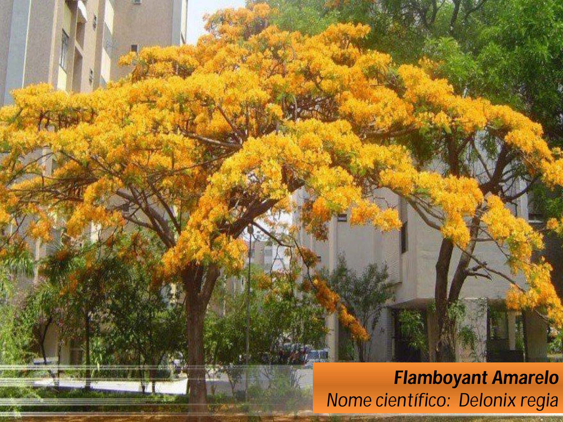
Flamboyant Amarelo Nome científico: Delonix regia