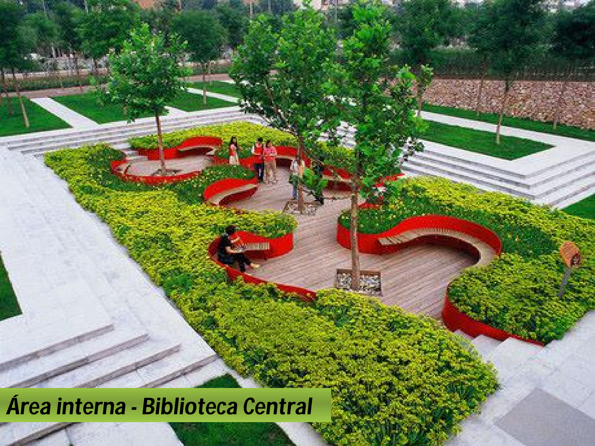
Área interna - Biblioteca Central