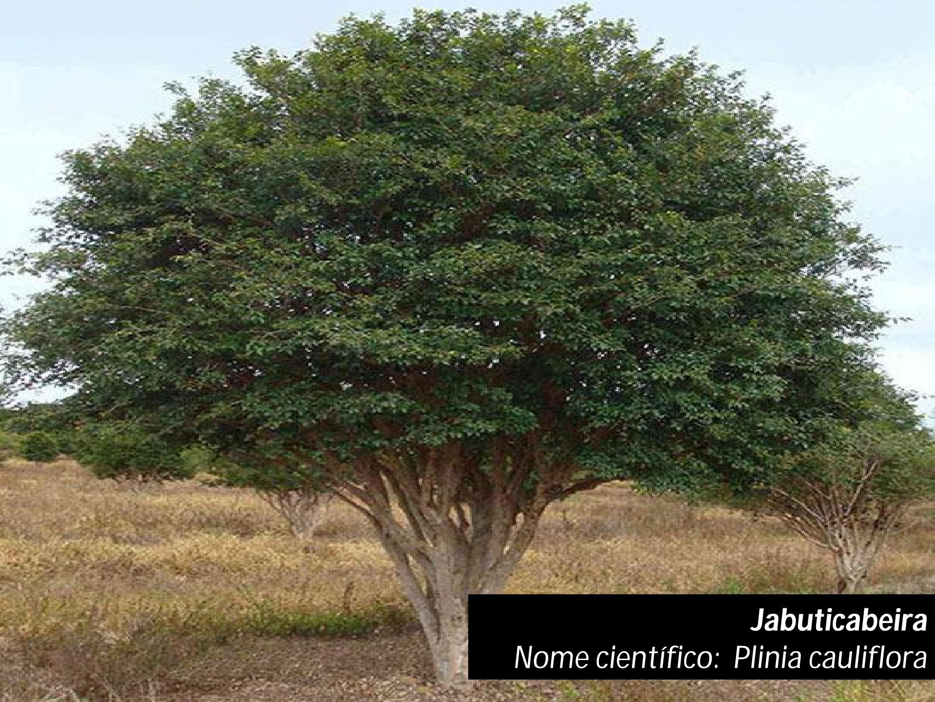
Jabuticabeira Nome científico: Plinia cauliflora