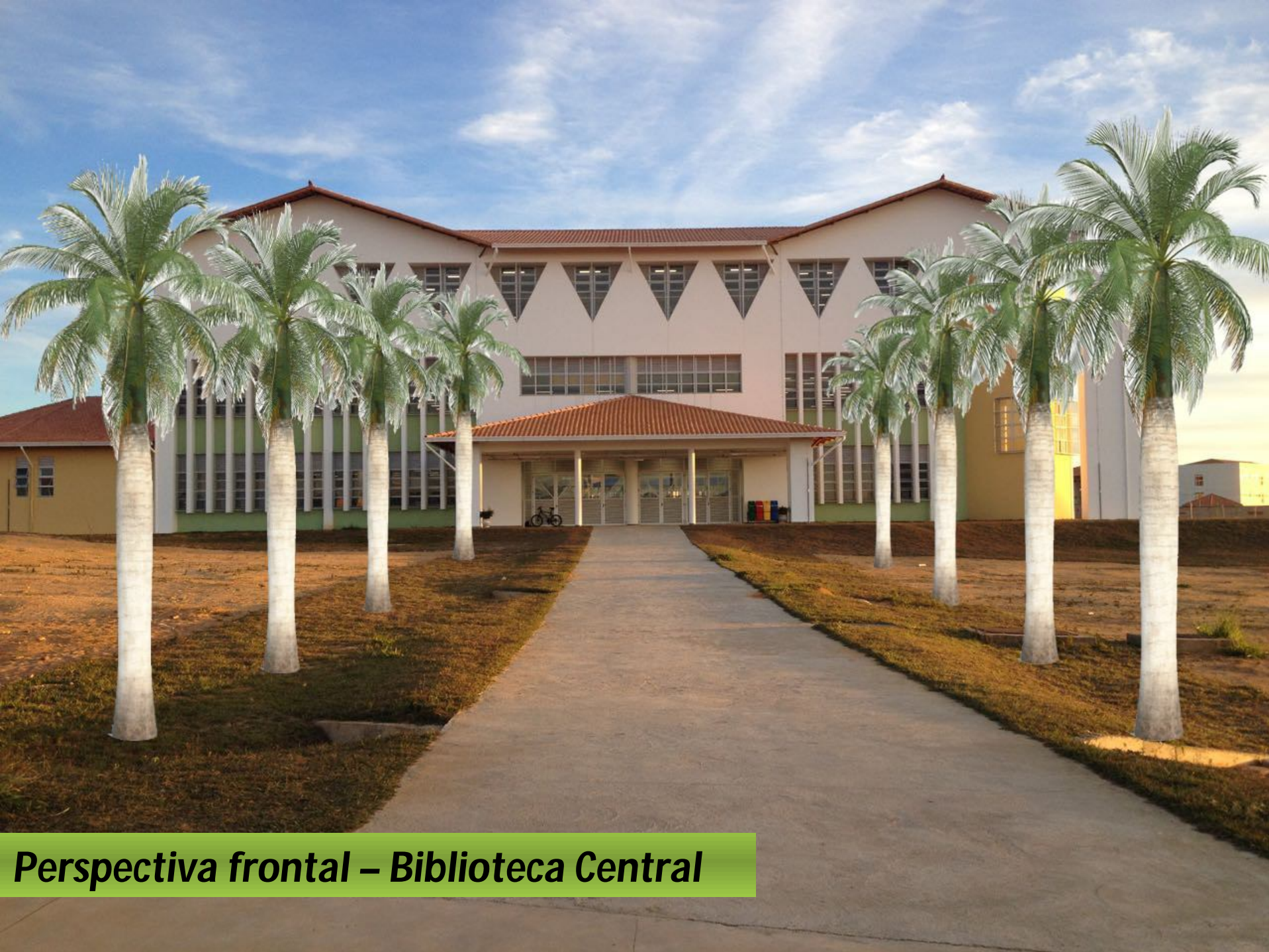
Perspectiva frontal – Biblioteca Central