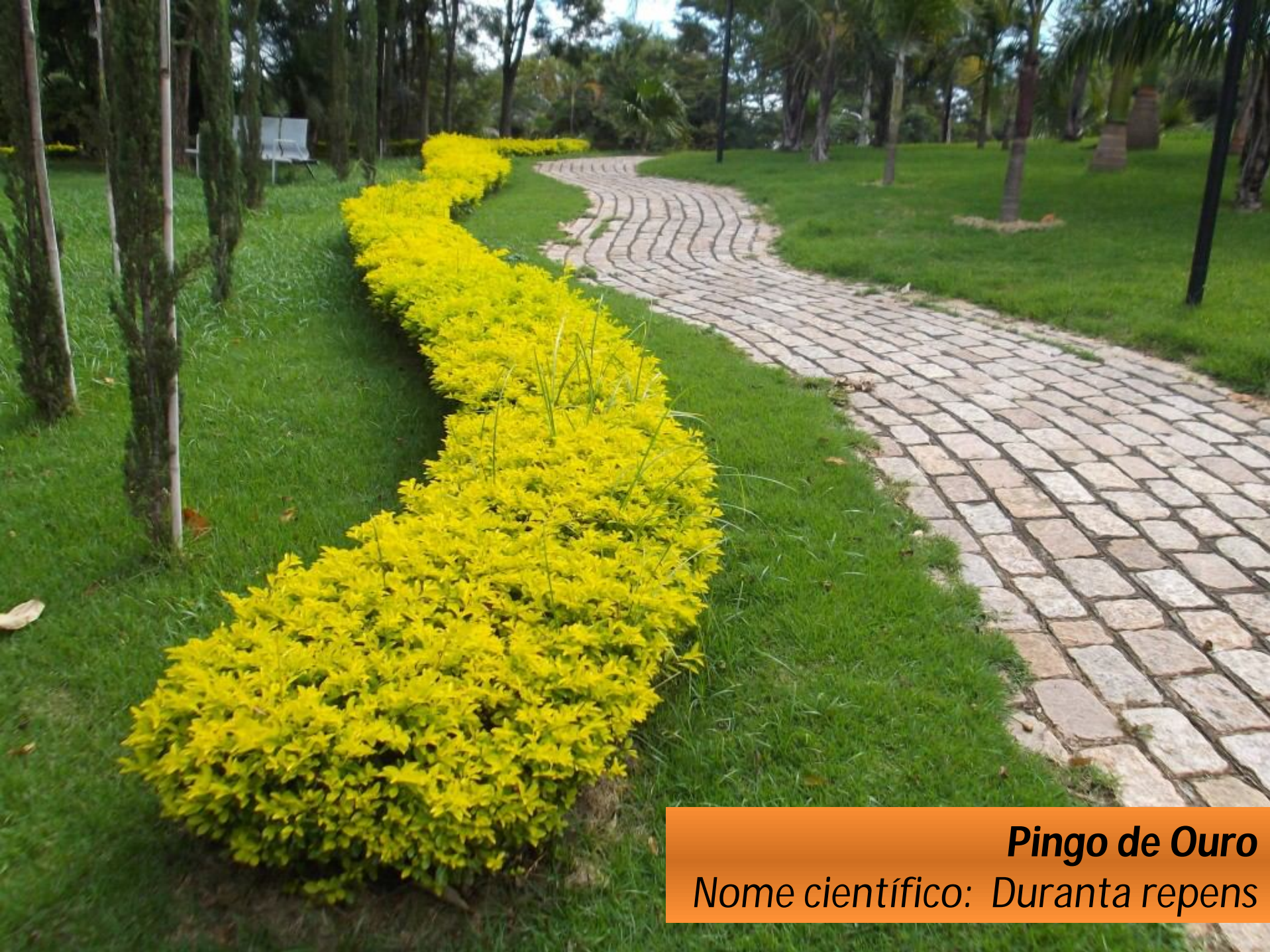
Pingo de Ouro Nome científico: Duranta repens