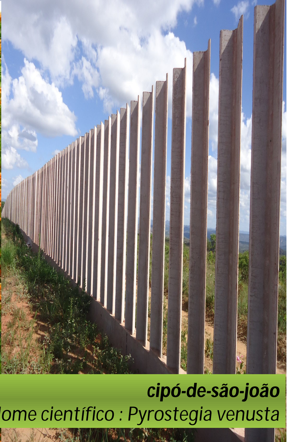
cipó-de-são-jão Nome científico : Pyrostegia venusta