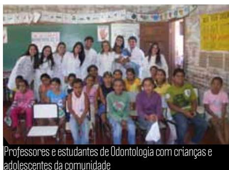
Professores e estudantes de Odontologia com crianças e adolescentes da comunidade

Fruto de uma parceria entre o Lions Clube de Diamantina e a UFVJM, através das Unidades Acadêmicas Faculdade de Ciências Biológicas e da Saúde (FCBS), Faculdade de Ciências Exatas (Facet) e Faculdade Interdisciplinar em Humanidades (FIH), foi realizada no mês de setembro uma