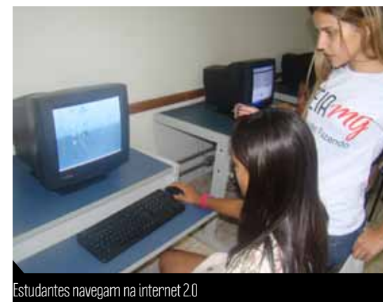
Estudantes navegam na internet 2.0

com o mundo. O Governo de Minas tem muita alegria em ver este projeto crescendo e levando oportunidades e cidadania aos jovens", finaliza o secretário.