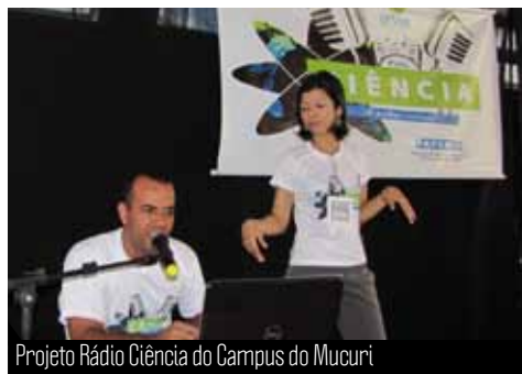
Projeto Rádio Ciência do Campus do Mucuri

vamente o Palco Livre. O III Simpósio de Extensão foi marcado por intensa participação da comunidade universitária e representou mais um importante passo para a construção das políticas de Extensão e Cultura na UFVJM.