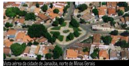
Vista aérea da cidade de Janaúba, norte de Minas Gerais