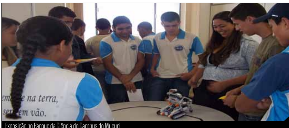
Exposição no Parque da Ciência do Campus do Mucuri