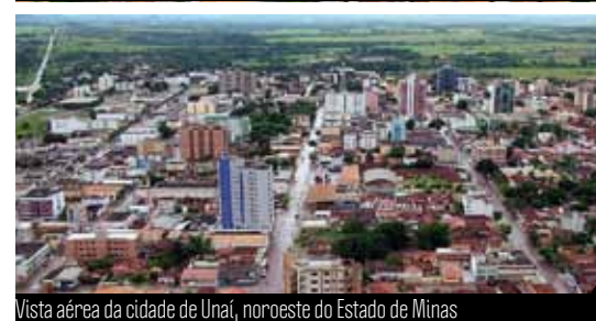
Vista aérea da cidade de Unaí, noroeste do Estado de Minas