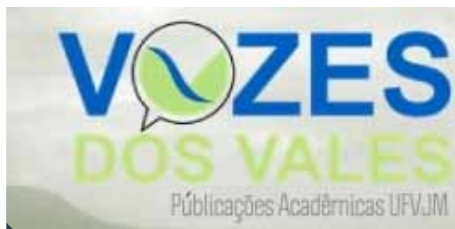
Voices dos Vales: primeira publicação acadêmica online da Universidade