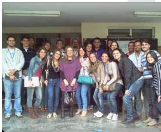
Professores e alunos do Programa Multicêntrico no II Encontro na Unifal

Nos dias 22 e 23 de outubro, todos os professores orientadores e alunos de pós-doutorado, doutorado, mestrado e iniciação científica do Programa Multicêntrico de Pós-Graduação em Ciências Fisiológicas da UFVJM participaram do II Encontro Científico do Programa Multicêntrico de Pós-Graduação em Ciências Fisiológicas, realizado na Universidade Federal de Alfenas. A UFVJM é uma das instituições associadas a esse programa e oferece os cursos de mestrado e doutorado em Ciências Fisiológicas, programa proposto pela Sociedade Brasileira de Fisiologia e formado por instituições nucleadoras e associadas.