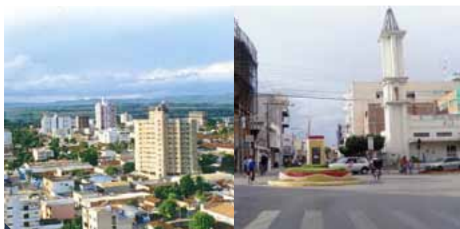
Unaí, noroeste de Minas e Janaúba, norte do estado, receberão campus da UFVJM