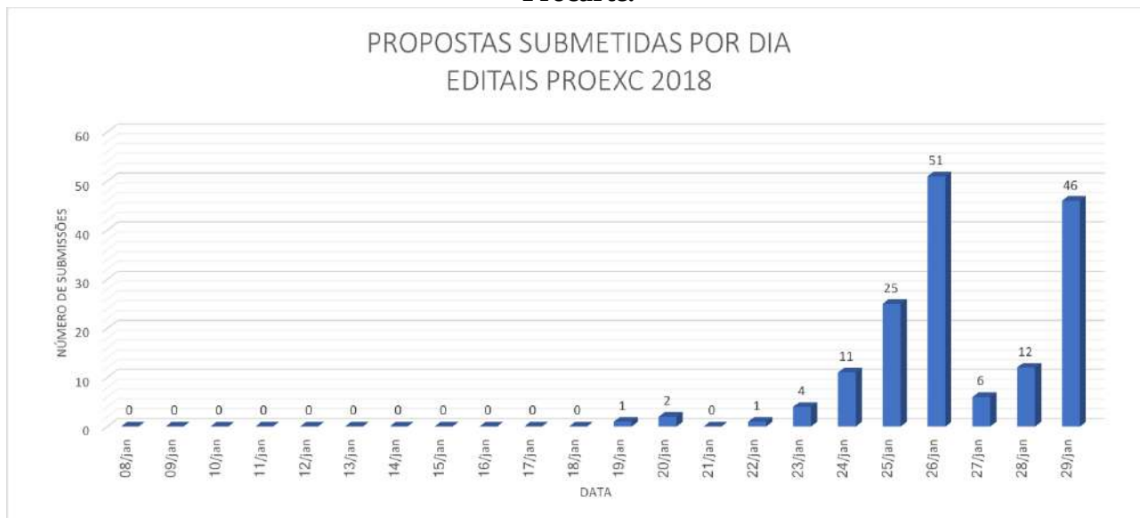
Gráfico 3 – Propostas totais submetidas por dia Editais Proexc 01 e 02 – 2018 – Pibex e Procarte.