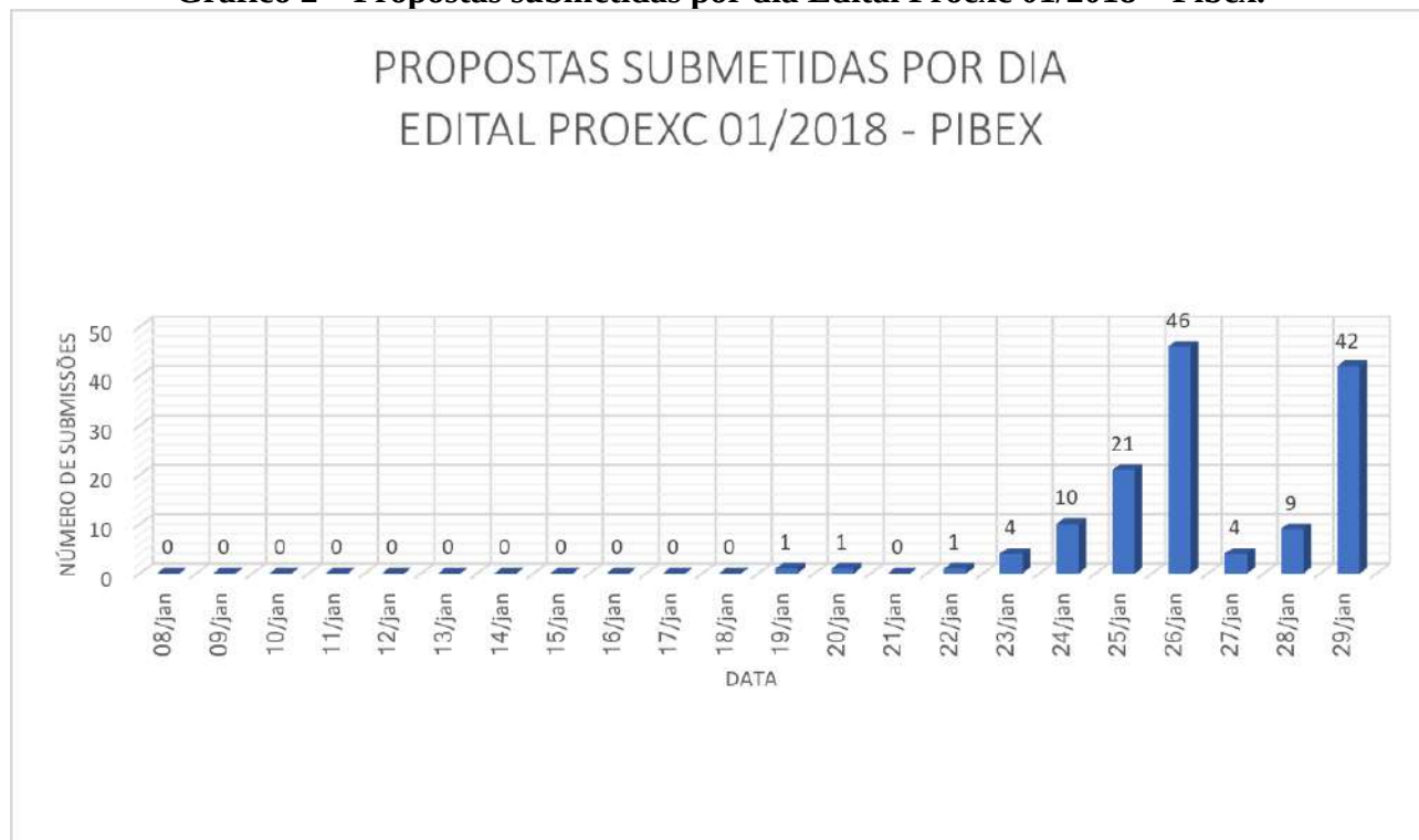
Gráfico 2 – Propostas submetidas por dia Edital Proexc 01/2018 – Pibex.